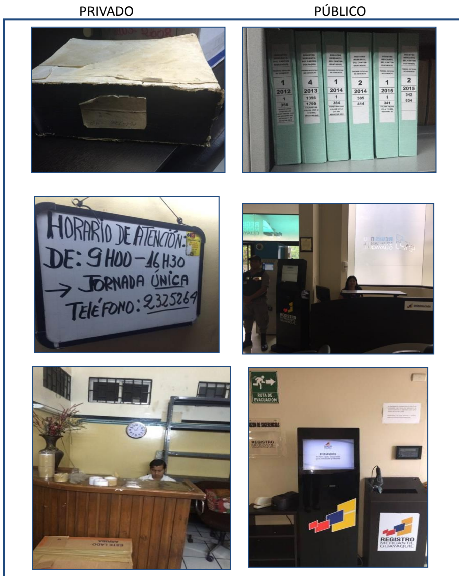
Gráfico Nro. 2: Fotos de archivos y fachadas privado versus públicos en Registro Mercantil de Guayaquil