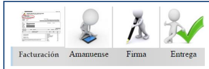
Gráfico Nro. 4: Proceso de certificación en el Registro Mercantil de Guayaquil