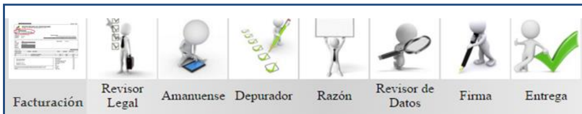
Gráfico Nro. 3: Proceso de inscripción en el Registro Mercantil de Guayaquil

La inscripción de los instrumentos públicos, tales como títulos, contratos y demás documentos que la ley exige o permite que se inscriban, es en cumplimiento a lo que dispone la Constitución, Código de Comercio, Ley de Registro, Ley Nacional de Registro de Datos Públicos, Ley de Compañías y demás leyes, a través de procesos establecidos, tiene principalmente como finalidad su publicidad, garantizando la autenticidad y seguridad jurídica.